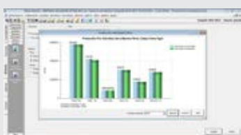
PRODUCCIÓN POR ACTIVIDAD

Les presentamos los nuevos gráficos, que encontrarán en el paquete 336 anunciado en este NOTIFYSIS. Los tres íconos nuevos contemplan diferentes modalidades de observar los stocks y la producción comercialización, y la liquidación de canje vincula con la factura de canje que corresponde.